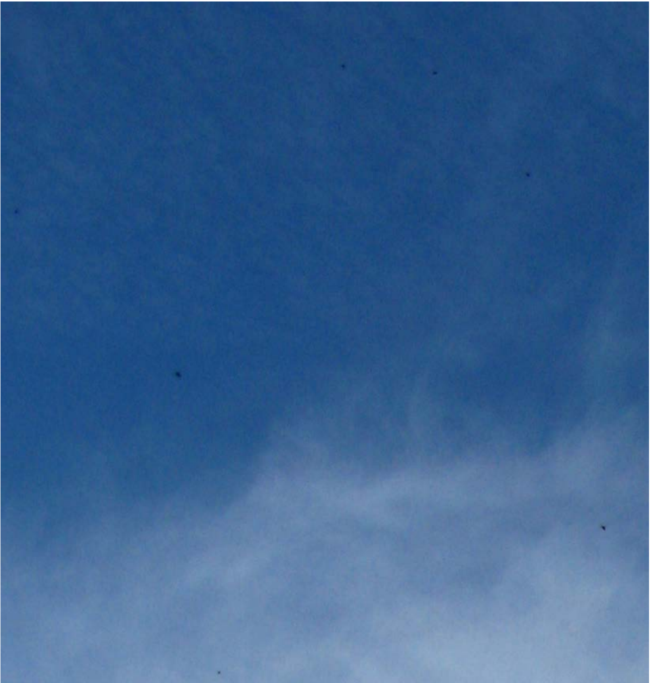
Agrandissement sur les 7 points (quart supérieur gauche)

Comme le témoin le fait justement remarquer, il pourrait difficilement s'agir d'avions : ceux-ci reflètent la lumière, et auraient été plus nets sur la photographie. De plus, le bruit caractéristiques des turboréacteurs civils (et a fortiori militaires) aurait été perçu. Nous restons en revanche plus réservés quant à l'appréciation de double formation triangulaire.