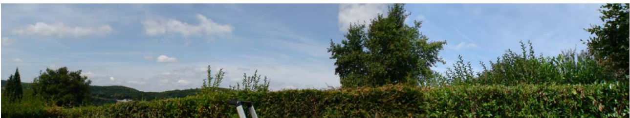
Panorama de la vue depuis le point d'observation du témoin

Le premier enquêteur a pris des photos, fait les relevés, interrogé le témoin et le voisinage.