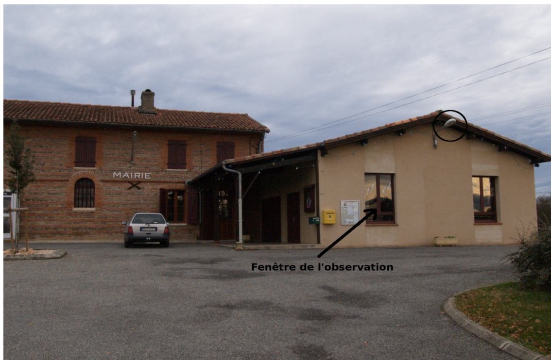
Positions de la fenêtre et du lampadaire sur le pignon de la salle communale