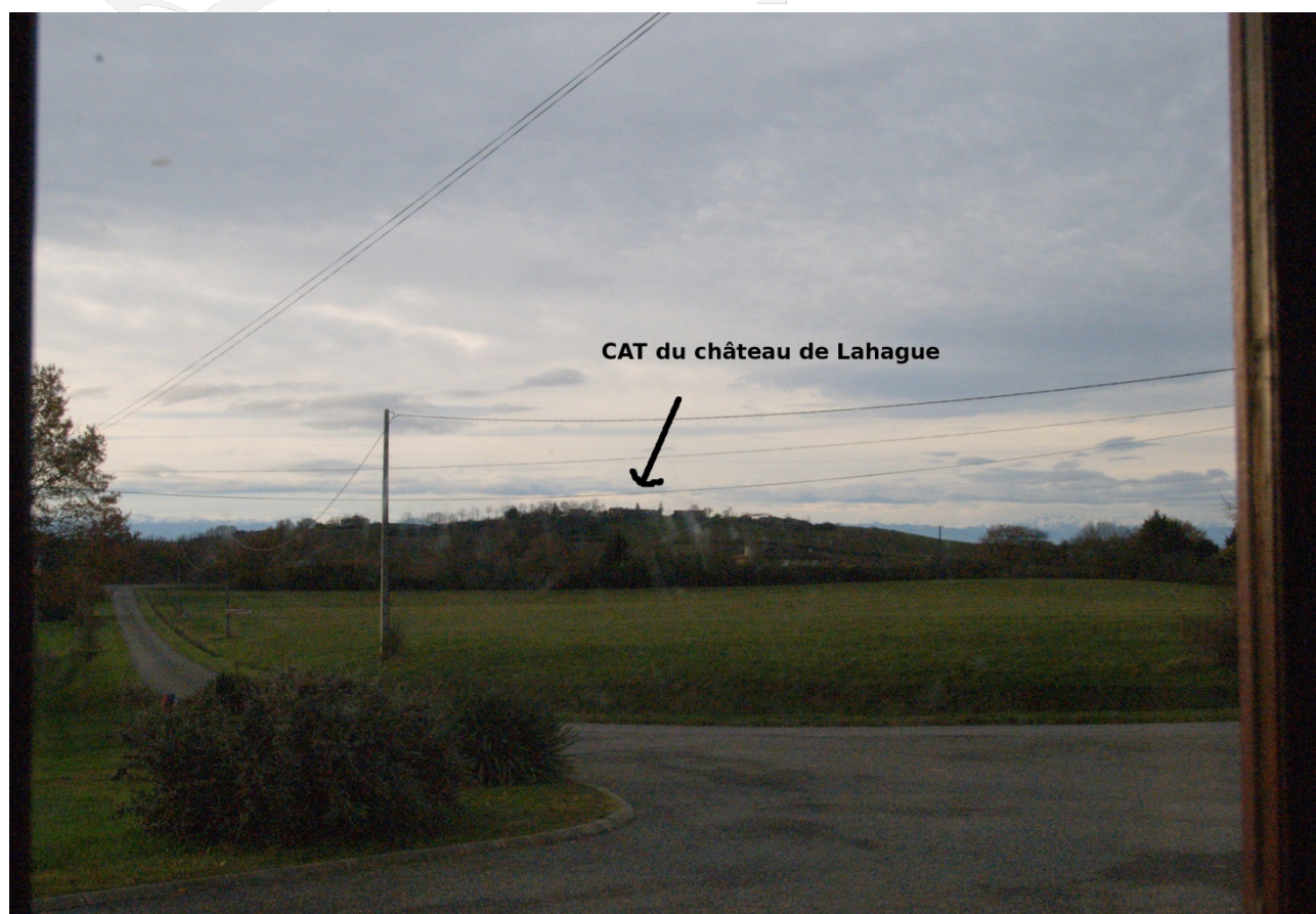
Vue depuis la fenêtre de l'observation