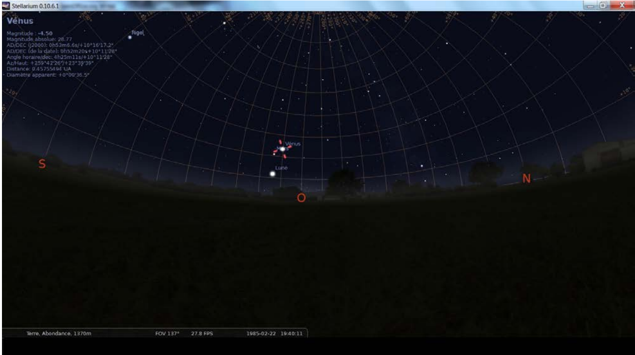
Figure 4 : Stellarium – reconstitution du ciel de l'observation à 19h40.

Une reconstitution sur Stellarium pour Abondance (coordonnées : 46°16'47" Nord, 6°43'22" Est) pour le 22 février 1985 à 19h40 montre la présence dans le ciel, à l'Ouest et à environ 25° de hauteur angulaire de la planète Vénus, alors particulièrement brillante puisque de magnitude -4,5 (Figure 4).