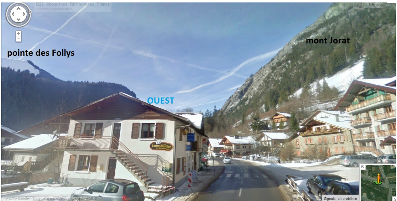
Figure 2 : Street View – reconstitution des lieux d'observation

Grâce à l'option Street View disponible sur Google Maps, il est possible de se faire une idée du paysage faisant face aux témoins. Il est à noter que les pentes du Mont Jorat masquent une grande partie de l'horizon compris entre l'Ouest et le Nord, vu depuis Abondance (Figure 2).