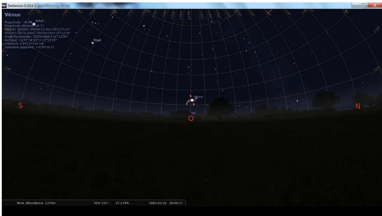
Figure 5 : Stellarium – reconstitution du ciel de l'observation à 20h40

Il est d'ailleurs à noter que durant cette heure d'observation, Vénus s'est déplacée de 10^\circ en azimut, de l'Ouest vers le Nord, ce qui est parfaitement cohérent avec les déclarations du témoin principal.