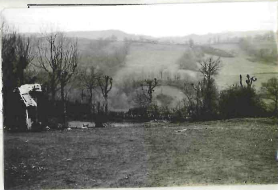
CLICHE N° :

Vue prise : de l'habitation de Mr M _____, à l'endroit X où l'en- gin a été aperçu par ce dernier