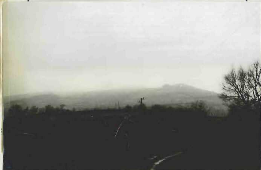
CLICHE N° 3

Vue prise : _____ plongé après son départ (Emplacement N° 1)/