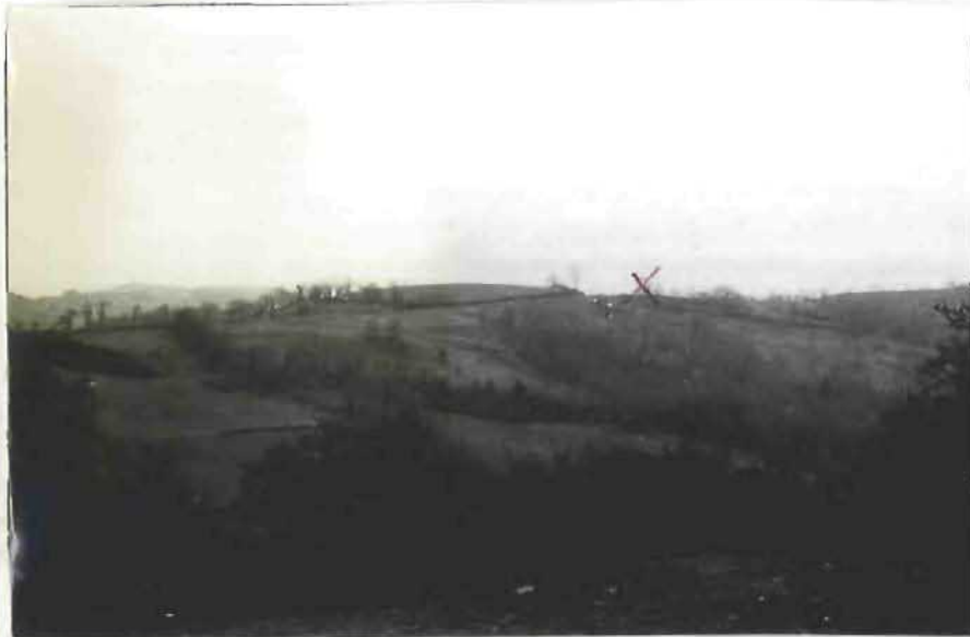
CLICHE N° : 1

Vue prise : Emplacement où l'engin a été vu pour la première fois par Mr M _____