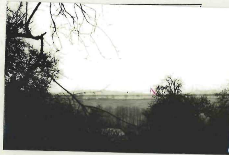
CLICHE N° 4

Vue prise : Emplacement où l'engin a été vu pour la première fois par Mr M _____