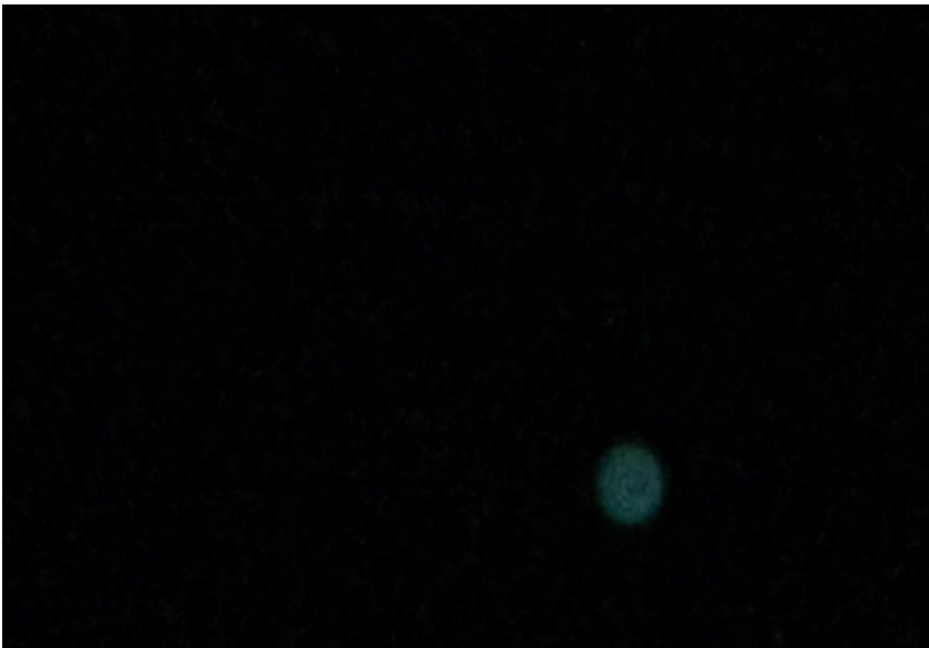
Capture d'écran N° 4