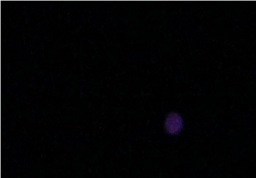
Capture d'écran N° 3