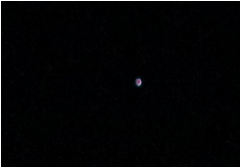
Capture d'écran N° 2