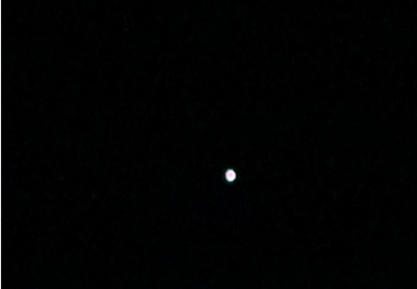
Capture d'écran N° 1

Capture d'écran de la vidéo filmée par le déclarant.