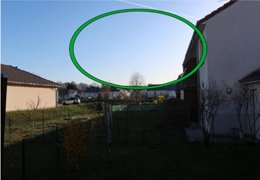
Photographie N° 1

Vue de jours de l'espace aérien où se trouvait la source lumineuse.