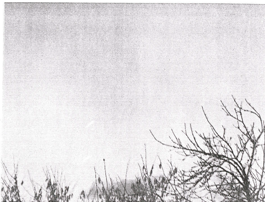
Vue des traces blanches dans le ciel, traces qui ne correspondent pas à un passage d'avion.