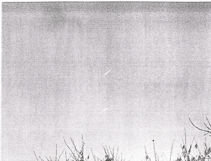
Vue rapprochée des traces dans le ciel.