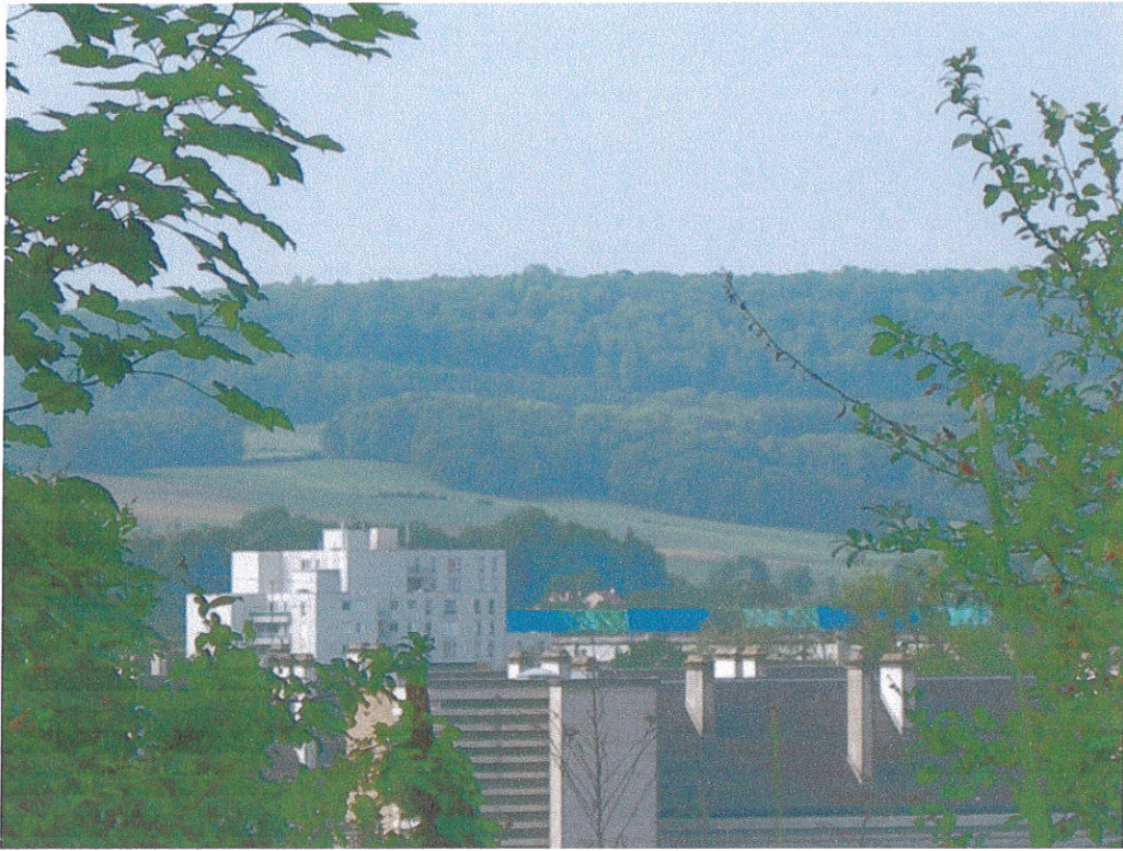
Le lieu dit la marfée de jour vue de notre terrasse.