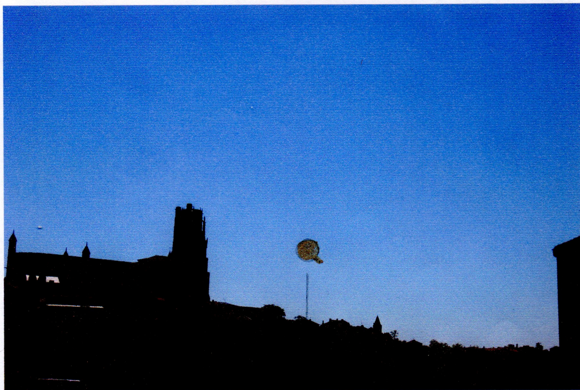
Photo de l'environnement plus dessin de phénomène lumineux observé